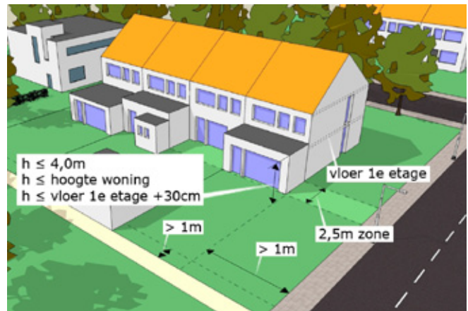
Binnen de 2,5 meter zone