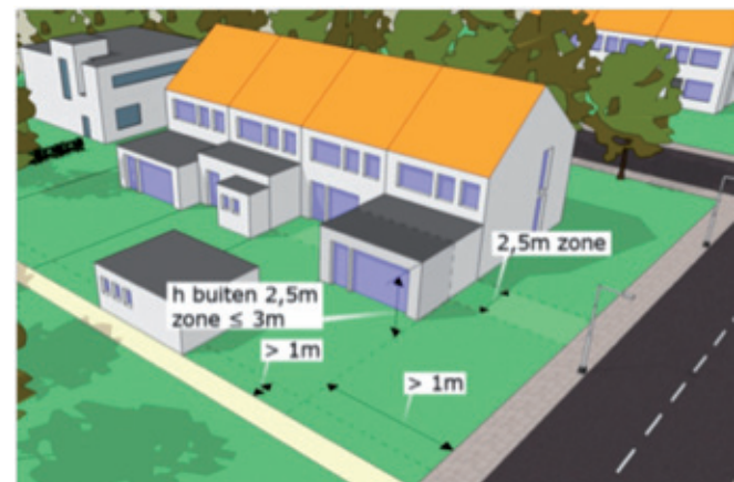
Buiten de 2,5 meter zone

Als er door de bouw van een bijbehorend bouwwerk een ruimte ontstaat die de 2,5 meter zone overschrijdt, dan geldt voor die gehele ruimte de eis van een ondergeschikt gebruik. Alleen als de ruimte binnen of ter hoogte van de 2,5 meter zone wordt afgescheiden met een scheidingsconstructie (muur of pui), kan de ruimte gebruikt worden voor de uitbreiding van de primaire functie van het hoofdgebouw, bijvoorbeeld als woonkamer.