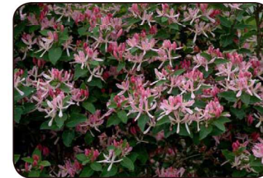
Lonicera tatarica 'Honeyrose':