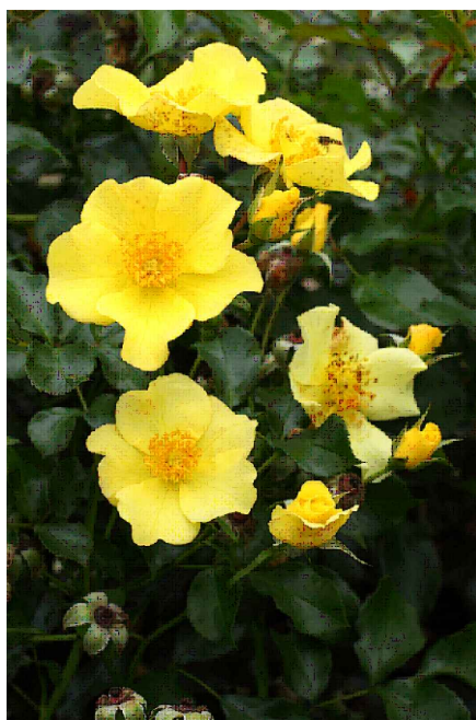
Rosa 'Flushing Meadow'