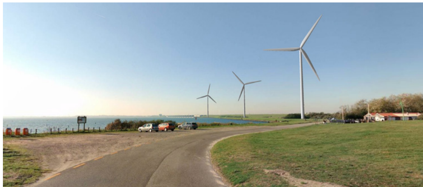
Er komen drie windmolens bij de Haringvlietdam

Waar je de windmolens ook plaatst, er zijn altijd mensen die niet blij zijn met een locatie. Begrijpelijk, als die dicht bij jou in de buurt is. Naast het uitzicht gaat het bijvoorbeeld om geluid en om de schaduw van de draaiende wieken (slagschaduw).